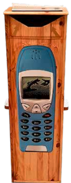
94 alte Handys landeten in der Mobile-Box.