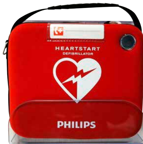
Ein Defibrillator kann Leben retten!

Alle Sponsoring-Verträge mit den örtlichen Sportvereinen wurden selbstverständlich aufrecht erhalten. Zwar waren coronabedingt kaum werbewirksame Veranstaltungen möglich, aber für die Gemeindewerke ist klar, dass gerade in schwierigen Zeiten alle Vereine erst recht Unterstützung benötigen.