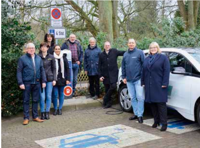
Das Veranstaltungsteam aus Mitarbeitern der Stadt- und Gemeindewerke

Kinderschminken, Blumen binden und einer Hüpfburg auf dem Gelände der Badestelle am Rantzauer See bietet Spaß auch für die Kleinen. Es soll ein Tag für die ganze Familie sein!