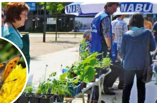
Links: ein Kleiner Feuerfalter auf einer Wiese. Rechts: Die Pflanzenbörse bietet eine Vielfalt von Gemüsesorten.